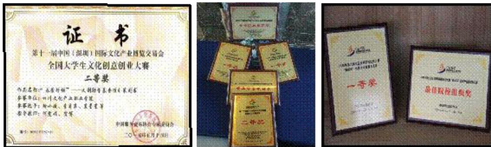
图 5 专业近年来国家级技能竞赛奖项

作为四川省文化经营与管理人才培养基地，近三年专业群学生先后荣获中国（深圳）国际文化产业交易博览会、全国大学生文化创意创业大赛二等奖等国家级奖项 15 项，有 42 人次获国家省部级奖项，137 人次获校级技能创业竞赛奖项；专业师生成功参与成都创意设计周、版博会等多项大型社会实践活动，学生专业能力和实践能力得到现场视察的国家、省委领导及社会各界广泛好评。近五年来，专业就业率均超过 95%，用人单位反馈好评度 82.5%，毕业生对母校满意度 78.5%。