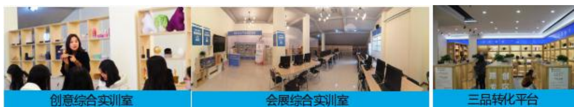
图2“三品转化”实践教学基地（部分）