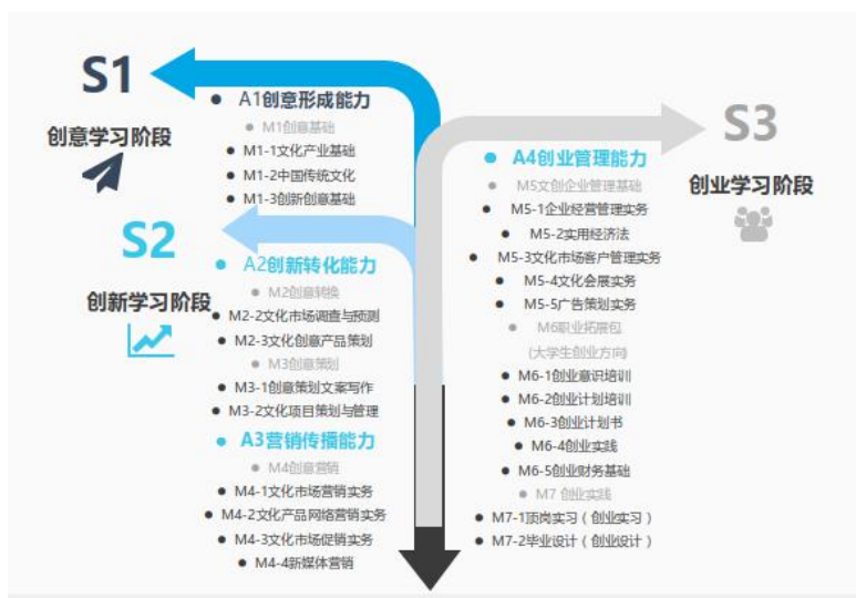
图 8 专业探索文化产业经管类专业核心能力

优化专业群内相关专业课程体系。以专业核心课程改革为主要任务，以教学团队建设为抓手，推动专业课程与教学内容改革； 推进专业群特色教材、教学资源的系统化建设 ，围绕“能文善商”的人才培养规格和专业课程体系，建设以“中国传统文化”等课程为代表的文化类专业基础课程；以“文化创新创意基础”“文化产品创意与策划”等课程为代表的专业技能课程。参与文化产业、会展国家教学资源库建设，加强教学信息化建设，推动各专业优质教学资源建设在国内同类高校间的推广运用。