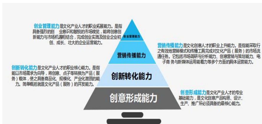
图 7 专业探索文化产业经管类专业核心能力

构建文化市场经营管理专业核心能力体系。围绕“创意形成能力”“创新转化能力”“营销传播能力”“创业管理能力”培养本专业学生的核心能力，并根据四种核心能力的教学特点，探索实施以“实例、实训、实景、实战”为核心的“4R”实践教学模式，打造专业特色和教学改革突破点。