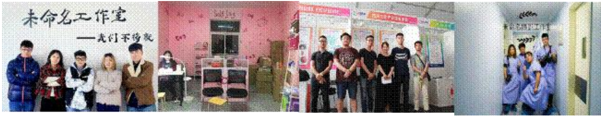
图 4 专业学生创业团队（部分）