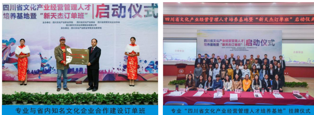
图 6 专业社会知名度和行业影响力不断扩大

专业以学校“五轴联动”合作育人机制为指引，充分发挥专业建设及四方资源优势，“校地”“校行”“校企”“校研”合作四轮驱动人才培养全过程，合力培养高级创新创业型文化经营管理人才。以合作办学理事分会和专业群合作建设指导委员会平台，不断创新合作模式，有效聚合地方政府、行业协会、文化企业、文化产业研究机构的优势资源融入专业人才培养全过程，通过共同研讨专业设置方向、共同制定人才培养方案、共同开发专业课程、共同开发校本教材、共同实施课程教学、共同开展师资队伍建设和实习实训条件建设等合作，合力培养高级创新创业型文化产业经营管理人才，社会影响力不断上升，社会美誉度不断增强。近三年共有 11 项校企合作项目落地，获得办学资金投入 24 万元、设备投入 50 余万元。专业与新天杰文化传媒有限公司合作培养的“新天杰订单班”，在西部地区率先探索文化创意人才订单式培养的路径。