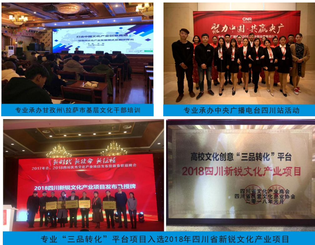
图3 专业社会服务能力突出